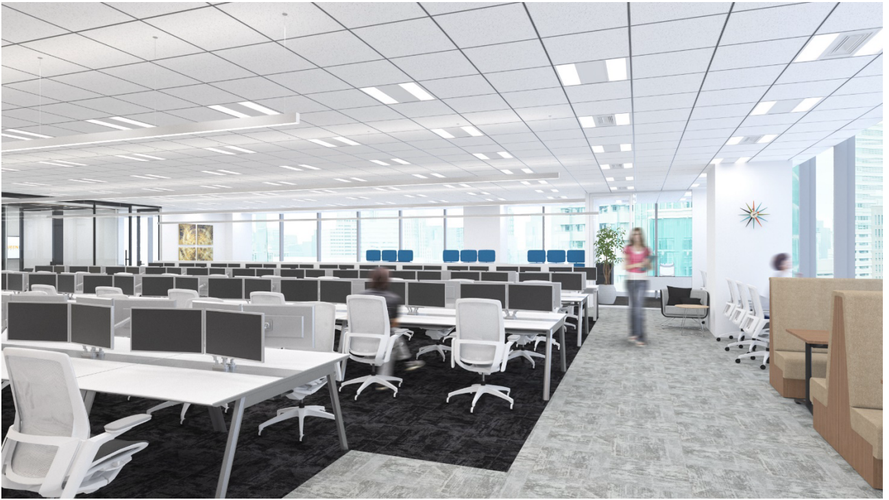
ワークスペース エリア