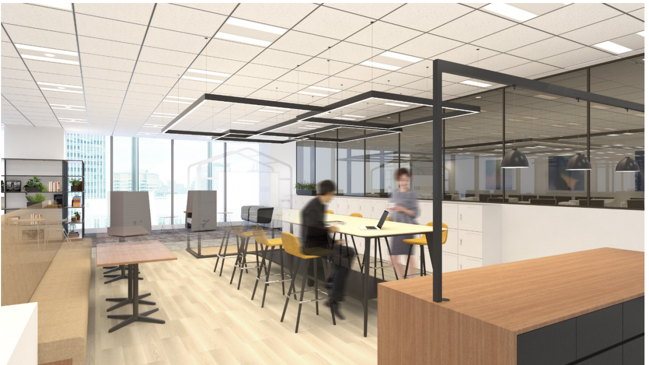
リフレッシュエリア